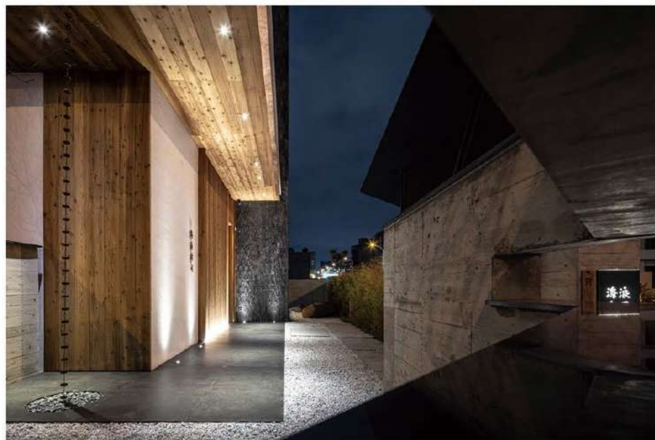
左頁・右頁：入夜後的海浪書局加劇光景的解讀對比，憑藉越深大福之際