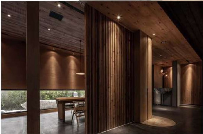
左頁、右頁：建築自外至內 運用大量自然材質鋪裝，以擬 海浪翻騰、縱橫浪石的姿態。