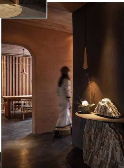
左頁、右頁：入夜時，光的投射軌跡與範圍 刻畫微小聚光，打造一處專注品味料理的場域